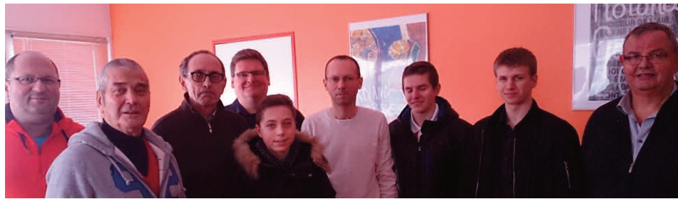
Les dirigeants de Ligue et les les arbitres de cette journée.

Les Championnats d'Alsace de doubles se sont déroulés sur le site du comité départemental du Haut-Rhin à Brunstatt le dimanche 8 février 2015.