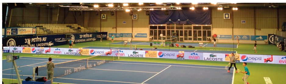
Les installations du tournoi.