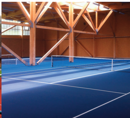
Les installations du TC 2 Tours

Le TC Les Deux Tours a clôturé la saison 2014 avec quelques 230 licenciés. On comptait plus de 126 jeunes pour 104 adultes.