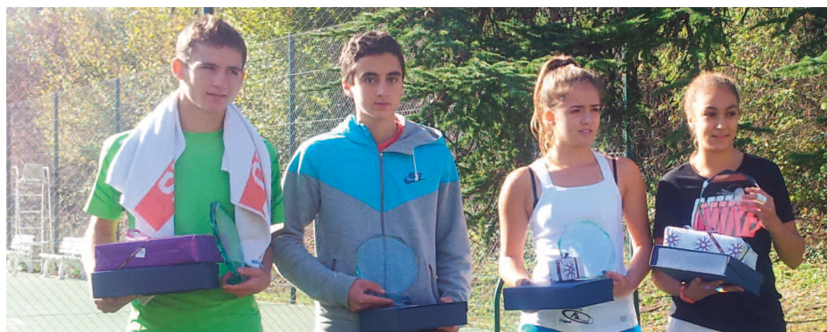
Vainqueurs et finalistes filles et garçons du National Cadets de Grenoble.