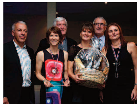
La remise des prix

AM : Il faut aussi s'organiser lorsqu'il y a des ren-