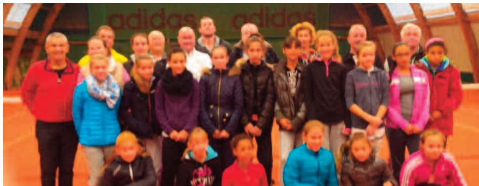
Les joueuses et encadrants de cette compétition.

Cette 5ème édition, organisée au TC Bischwiller en collaboration avec le Comité départemental de tennis du Bas-Rhin, a permis au public de voir évoluer 16 jeunes filles de 11 ans révolus dont 5 d'entre elles sont 2ème série.