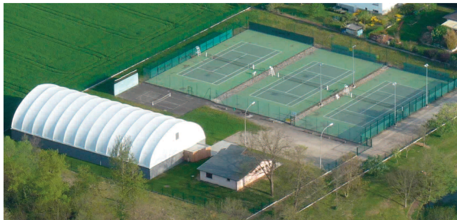
Les installations du TC Issenheim